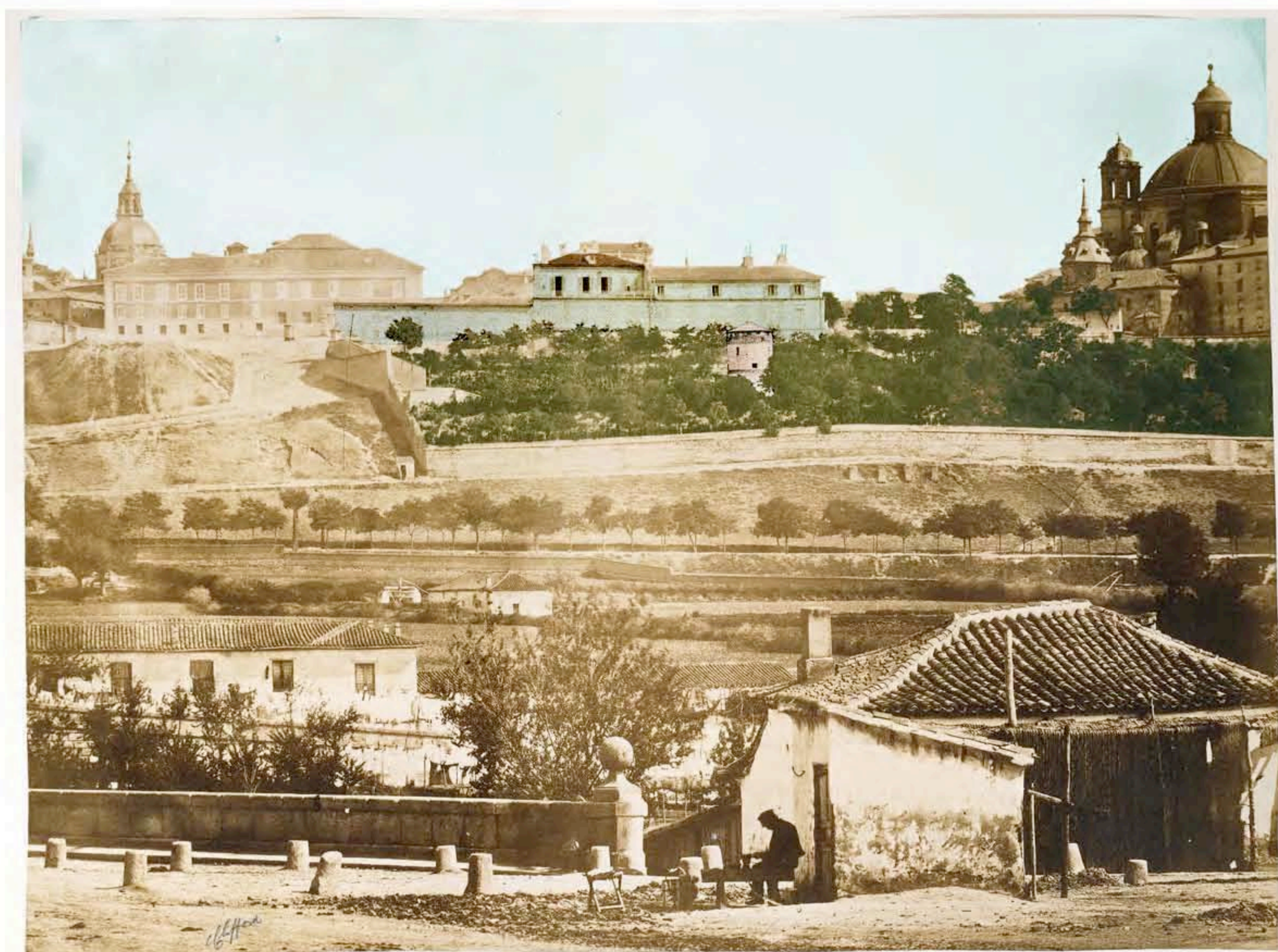
Fotografía tomada por Charles Clifford por encargo de los Duques de Osuna hacia 1853.

Ruego contestación por correo certificado a nombre del presente signatario por correo certificado a la siguiente dirección: XXXXXXXXXXXXXXXXXXXX Madrid