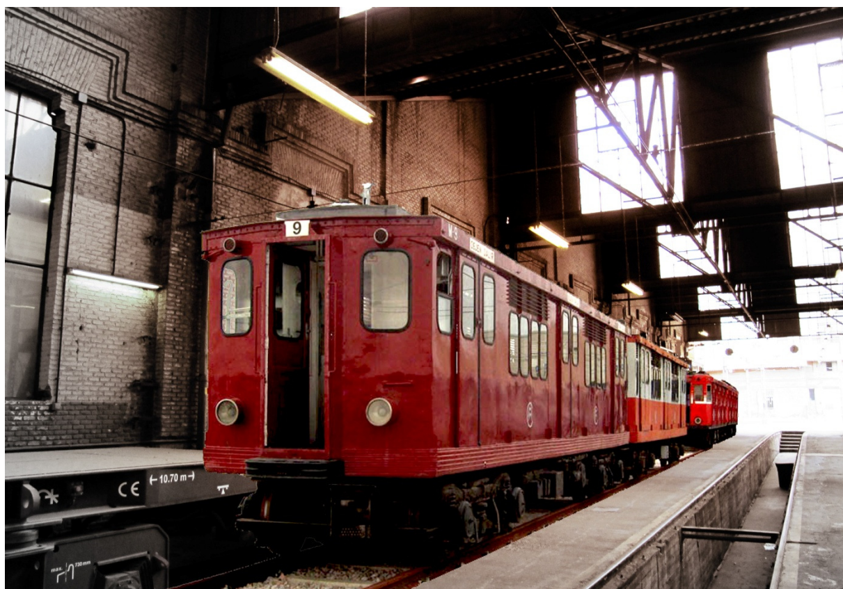
Las Cocheras de Cuatro Caminos podrían albergar la colección de trenes históricos de Metro. Fotomontaje de MCyP -2015.

TWITTER: @Salvemos4C FACEBOOK: salvemos.cuatrocaminos