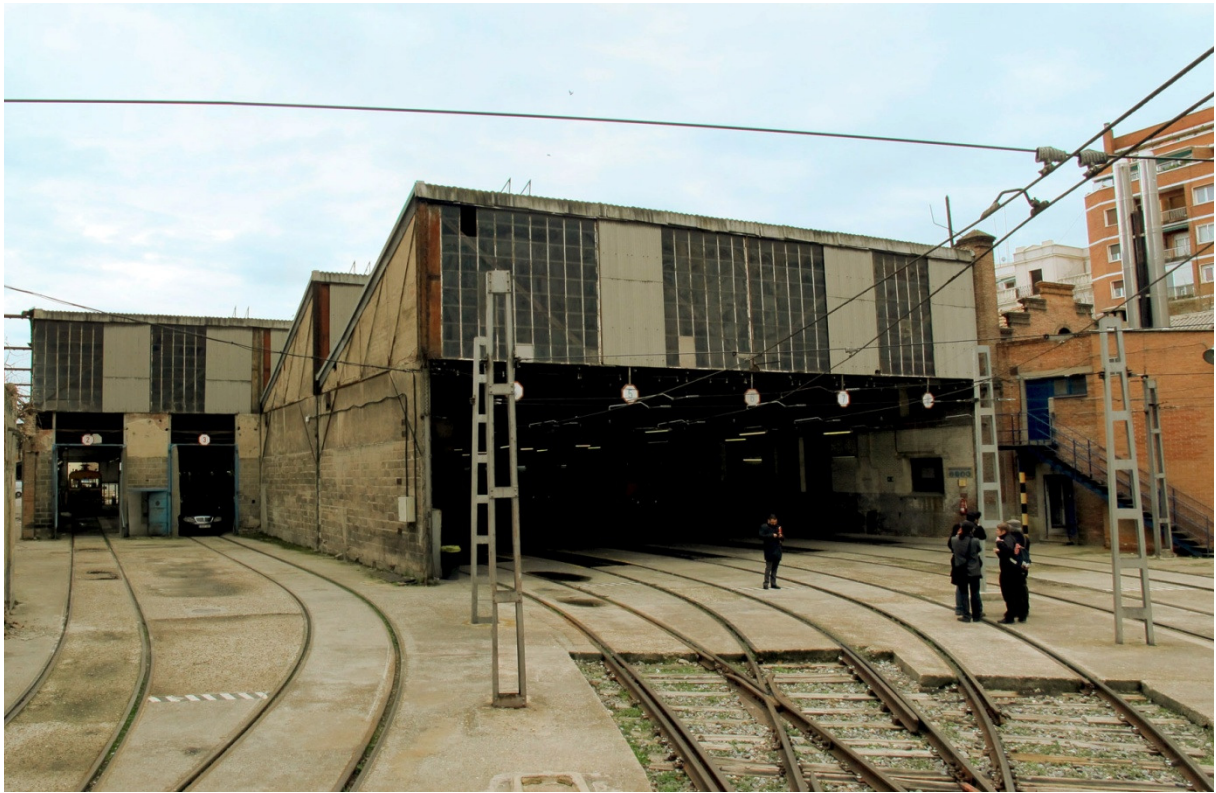
Vista de las naves originales (1919) de las Cocheras de Cuatro Caminos de Metro.