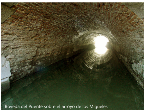
Bóveda del Puente sobre el arroyo de los Migueles