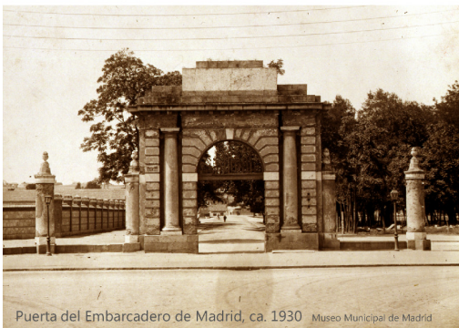
Puerta del Embarcadero de Madrid, ca. 1930