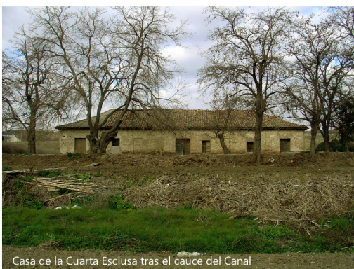
Casa de la Cuarta Esclusa tras el cauce del Canal