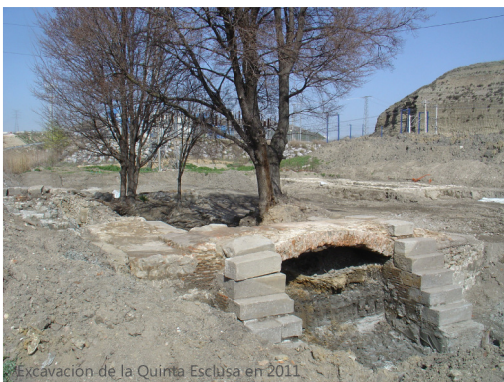
Excavación de la Quinta Esclusa en 2011